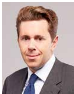
Dr. Harald Mahrer, Bundesminister für Wissenschaft, Forschung und Wirtschaft